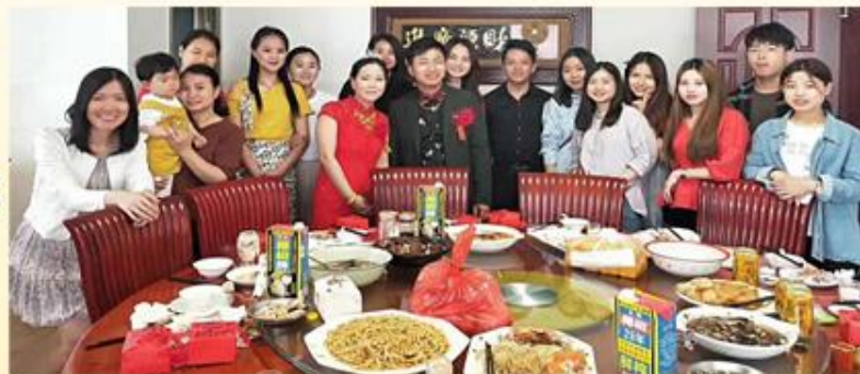
院外孩子小琴大婚之喜，众多爱心家长和儿童村伙伴同心到贺