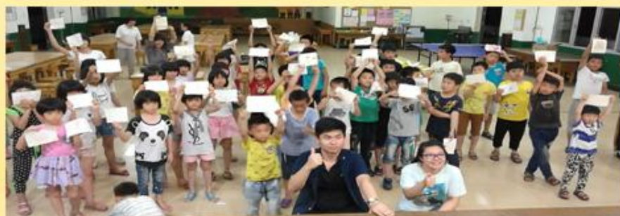
香港四位中六学生完成公开考试后，到儿童村服务一个月