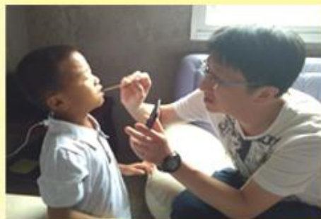
董事李医生为孩童检查口腔