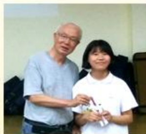
院监陈伯伯虽然年事已高，仍不辞劳苦，从美国来探访我们，关心我们，给予孩子奖励。