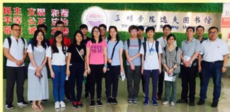
到三明学院参观交流