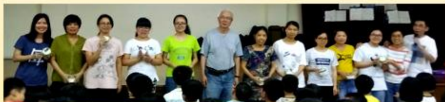
母亲节，孩子表达感谢，折花、写信，自制贺卡，让我们为母的心得着滋润，甜甜蜜蜜。孩子们，愿你们继续在爱里快乐成长!