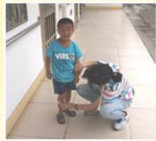
探访新孩子的情景