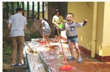
劳动节，齐干活，乐烧烤